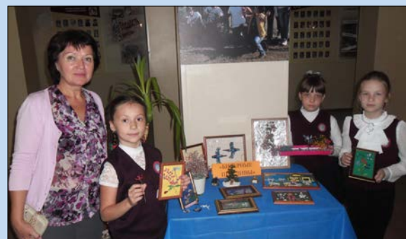
Девочки показали, что из бисера можно создавать настоящие шедевры

пытались повторить первые балльные па. Много народу собрали вокруг себя секция таеквондо. Тут можно было даже сфотографироваться с настоящими наградами и кубками, а их у наших спортсменов очень много, в том числе и мирового уровня. Увлекло юных гимназистов и выступление пресс-центра «Перспективы». В телестудии можно перед камерой примерить на себя роль репортера. А редакция газеты показала смешную сценку, как проходит выпуск газеты. Экологи школьного объединения «Экодело»