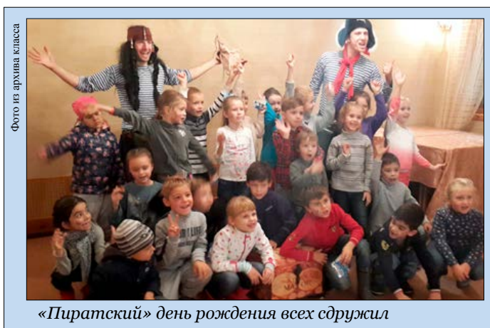
«Пиратский» день рождения всех сдружил

После мы еще немного побегали на территории турбазы, искали грибы и осенние листочки, пускали кораблики в бассейне и играли в догонялки. К концу дня мы совсем выбились из сил и счастливые отправились домой отдыхать. Наш класс отлично отметил этот замечательный праздник. Прекрасно, что есть такие традиции. Будем с нетерпением ждать новых веселых совместных походов.