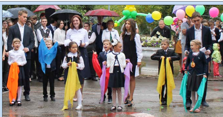
Эмоциональные первоклассники привели всех в восторг