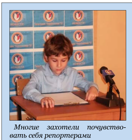
Многие захотели почувствовать себя репортерами