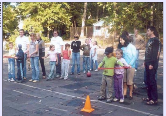
Самый смешной конкурс