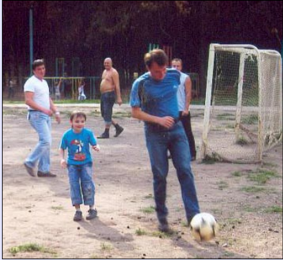
Папы играли вместе с нами в футбол