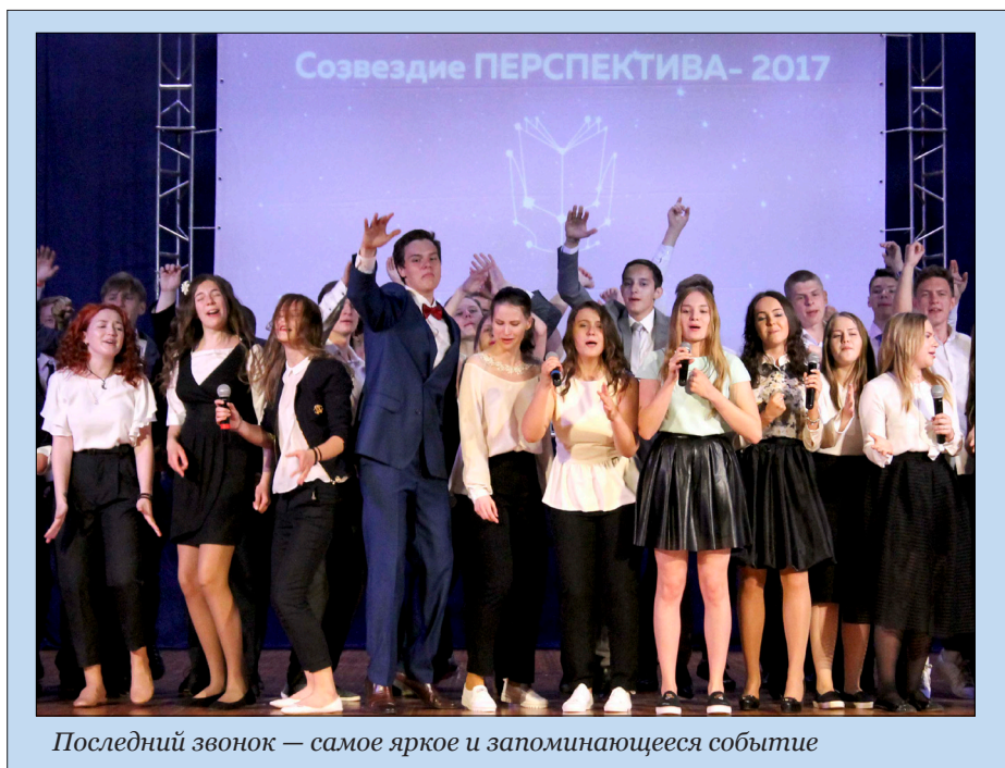
Последний звонок — самое яркое и запоминающееся событие