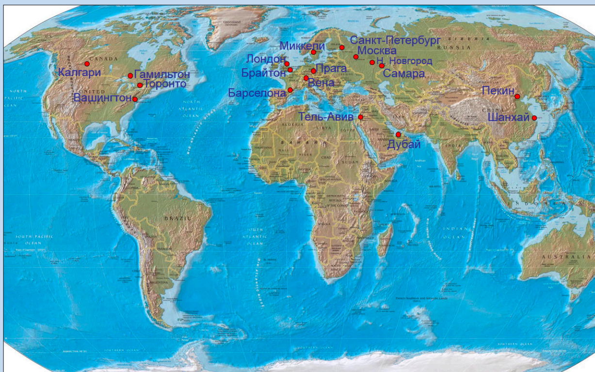
На карте обозначены города учебы выпускников всех лет. Америка, Европа и Азия — наши есть везде.