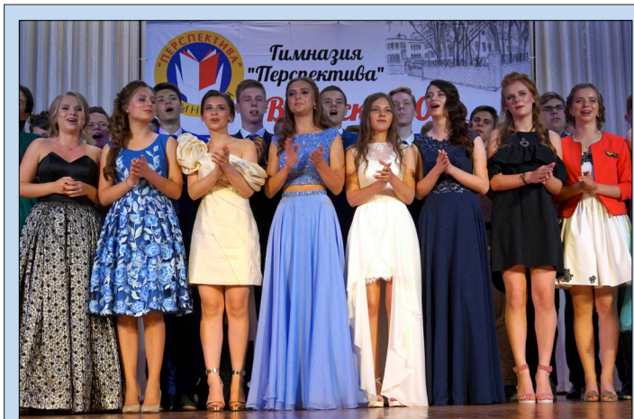
Выпуск 2017 года попрощался с гимназией

Удачи выпускникам 2017 года! Гимназия следит за вашими успехами и всегда ждет в гости!