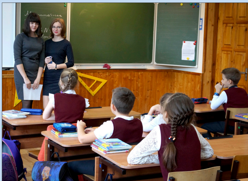
Ученики внимательно слушали своих новых учителей