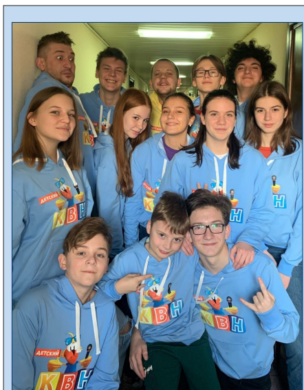
«Перспектива» вырвалась в полуфинал телевизионной лиги

Команд было много, из самых разных регионов нашей страны. Были ребята, уже знакомые нам по играм в Анапе. Конечно, приехали и подготовленные кавээнщики из Москвы. По расписанию съемок в день было по две игры, в каждой — по шесть команд. «Перспектива» должна была соревноваться с пятью опытными