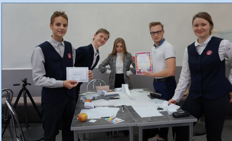
Первыми стали гимназисты 10Б класса