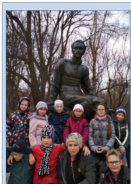
У памятника М. Ю. Лермонтову