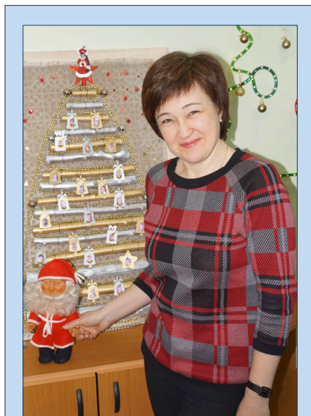
А вы загадали желание?