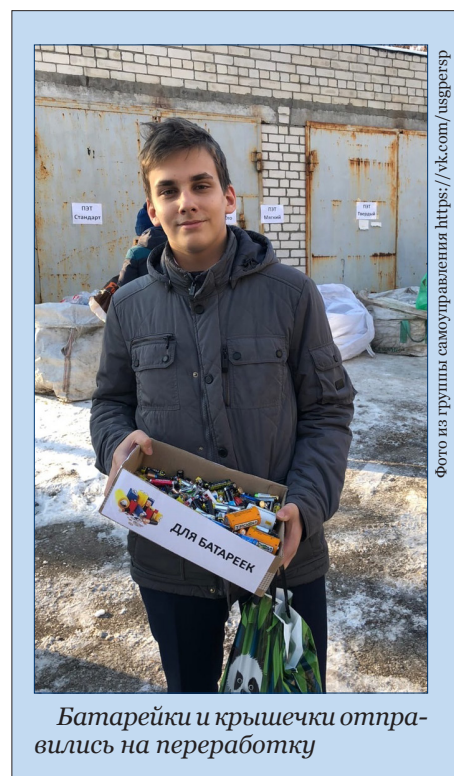
Батарейки и крышечки отправлены на переработку