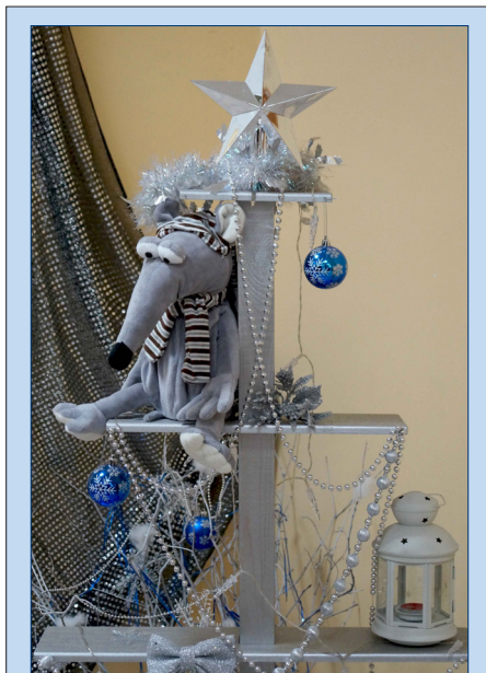
Новогодняя мышь на эксклюзивной елке от 8Б

Канун Нового года — это время, когда я вместе со своей семьей вспоминаю то, что произошло с нами в прошедшем году. Мы вместе смеемся над самыми забавными и удивительными историями. Еще мы говорим о том, что ждет нас в наступающем году, строим планы на будущее. А я мечтаю, чтобы Новый год был наполнен яркими и интересными событиями, и под бой