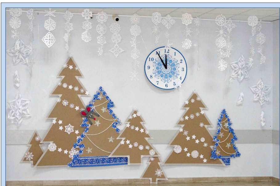
Благодаря стараниям 5Б и 5В классов на третьем этаже перед актовым залом вырос сказочный заснеженный лес