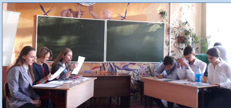
Команда гимназии (слева) на пути к победе