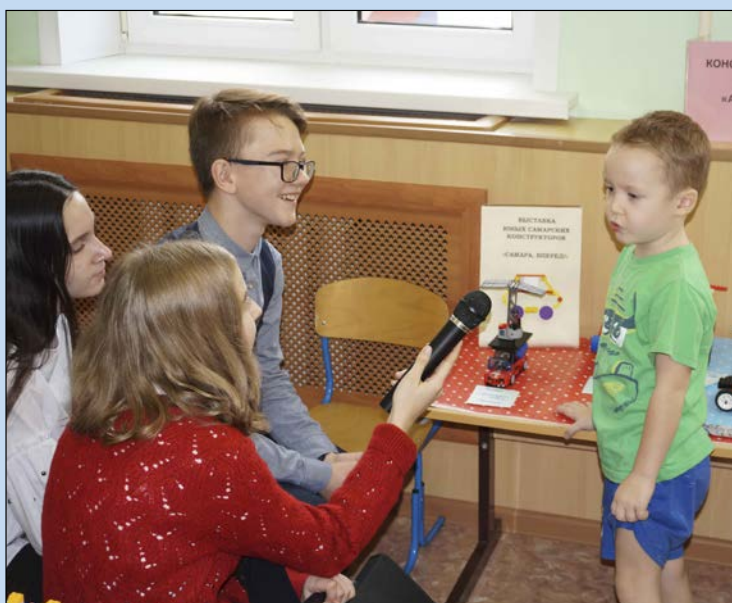
Комментарии конструктора бюро «АВТОфокус»