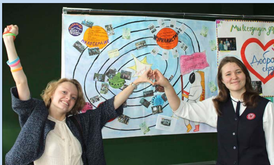
Авторы на фоне победившего плаката, над созданием которого трудились девочки всего отряда «Сириус»