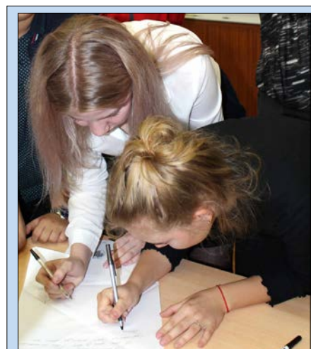
Письмо с фронта: «Мама, я вернусь домой!»

Наша станция показывала, на что способны люди во время войны. Никто из солдат не отчаялся, когда закончились все конверты. Смекалка красноармейцев позволила им быстро выйти из положения. Каждое письмо было пропитано патриотизмом, верой в скорую победу и желанием отстоять свою родину. Станция «Письмо с фронта», как и все другие, была направлена на то, чтобы показать волонтерам, какова была жизнь во время войны. После выполнения заданий у участников появлялась гордость за свою страну и веру в лучшее.