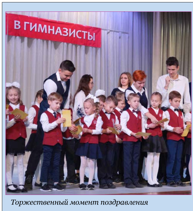
Торжественный момент поздравления

Ученики первых классов успешно стали гимназистами. По традиции посвящение провели будущие выпускники.