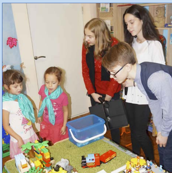
«А у нас зоопарк»