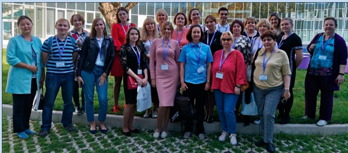
Участники образовательной сессии в «Сириусе»