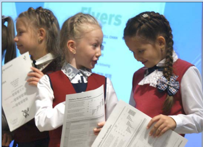
Первая ступень пройдена!