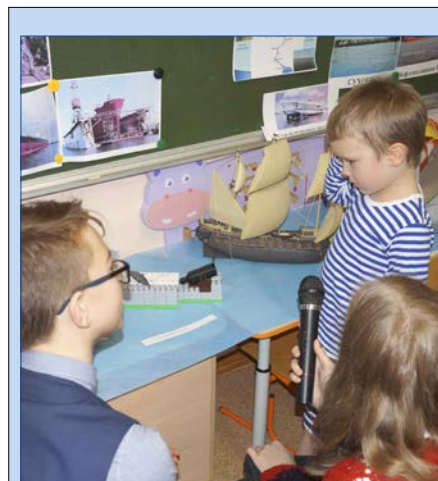
«Мы с папой строили корабль»

Юные изобретатели понимали многие фразы без помощи нашего «переводчика» и отвечали нам на английском языке. «Эта работа пока-