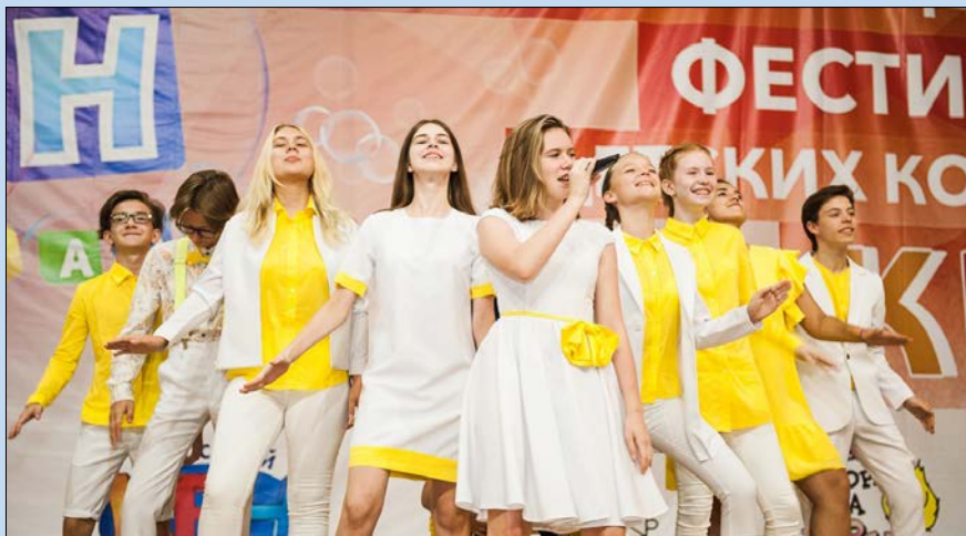
В Анапе наша команда открывала Гала-концерт