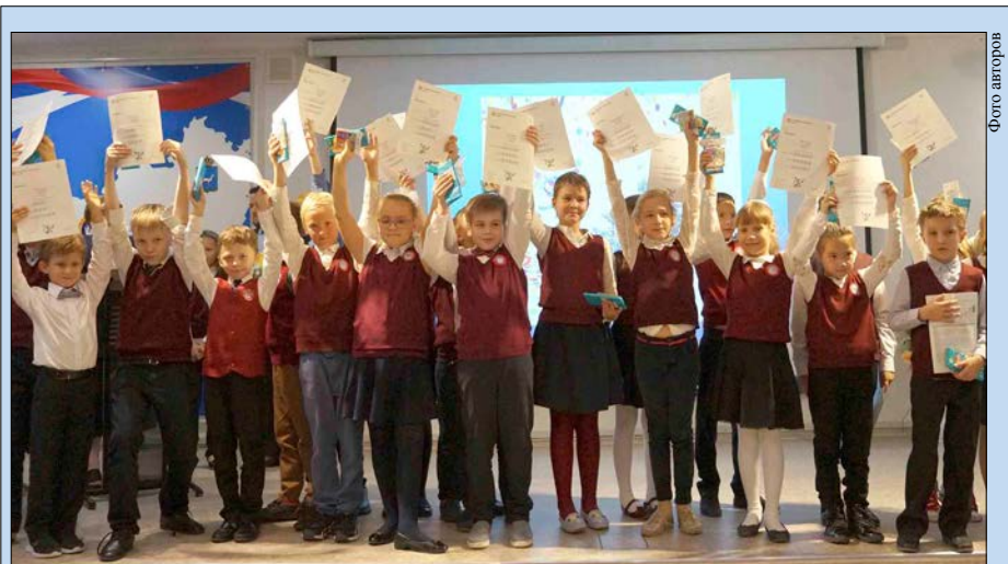
Младшие гимназисты — самые активные участники кембриджских тестов