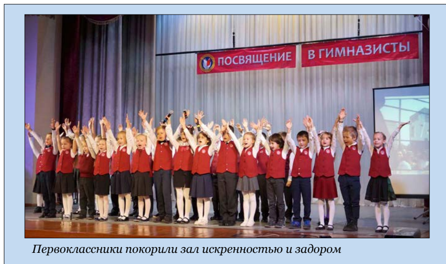
Первоклассники покорили зал искренностью и задором