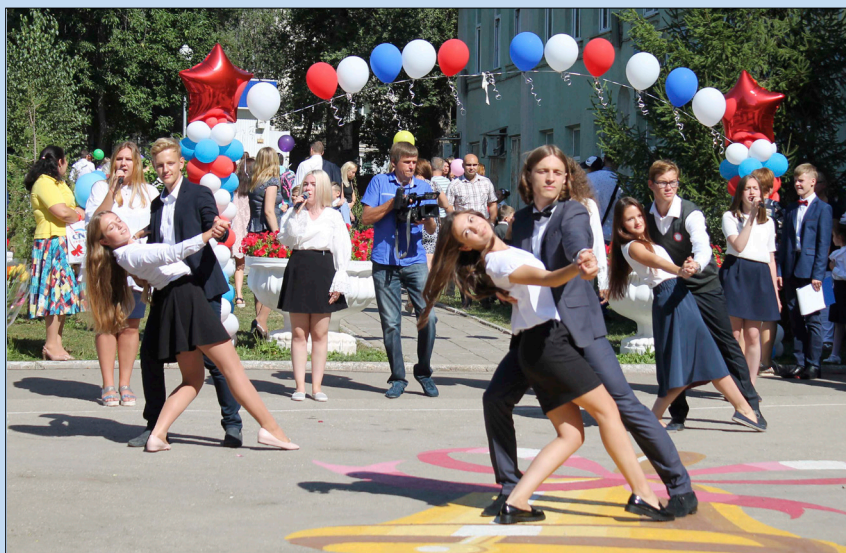
Флешмоб начинался с классики