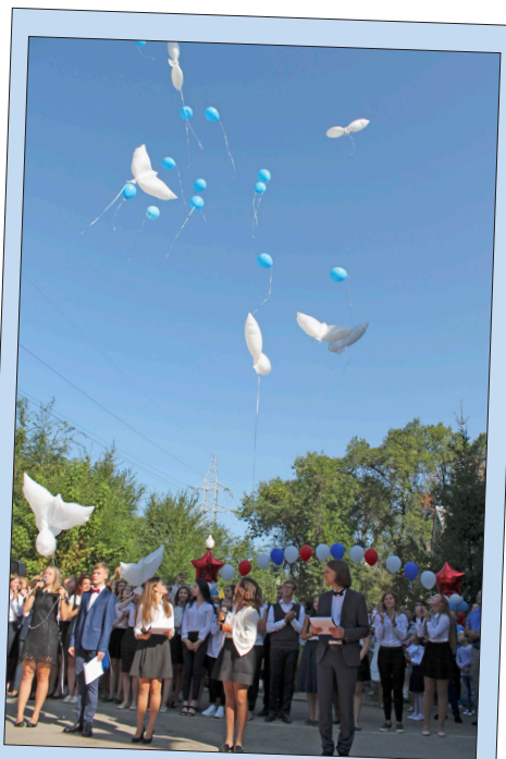
Воздушные голуби взмыли в небо