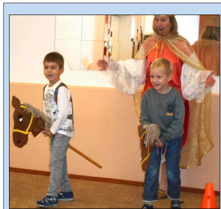
Мальчишки подняли настроение Несмеяне «бегами» на лошадках