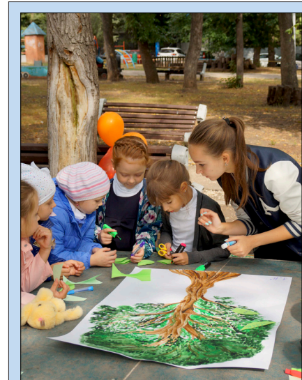
На дерево класса каждый ученик наклеил листочек со своим именем

Праздник удался! Впереди гимназию ждет непростой учебный год, а уже в следующем сентябре она будет отмечать свое двадцатипятилетие. Хочется пожелать любимой школе только процветания, сохранения теп-