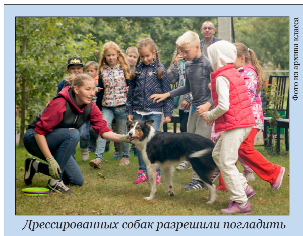
Дрессированных собак разрешили погладить

И в завершение счастья — футбол! Играли и папы, и мальчики,