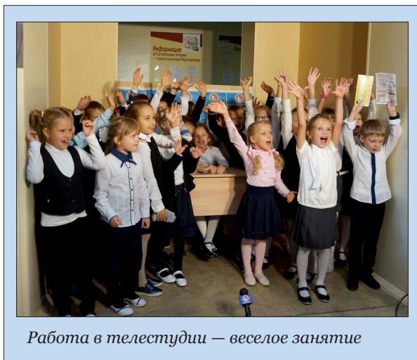
Работа в телестудии — веселое занятие