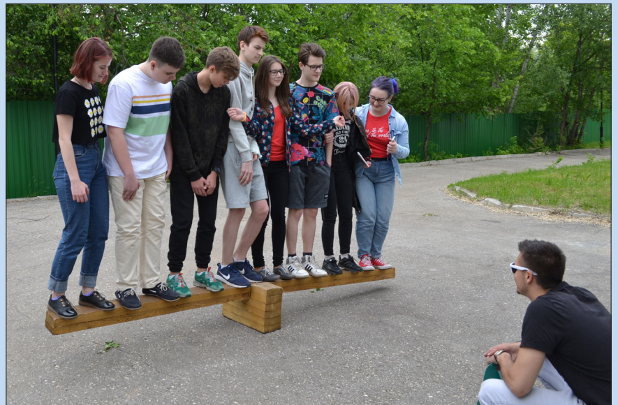
Никогда не знаешь, где и когда могут пригодиться школьные знания

Возможно, мы не будем применять все изученные законы, формулы, вычислять, сколько весит тот или иной элемент, но физика несомненно присутствует всегда вокруг нас, хотим мы этого или нет».