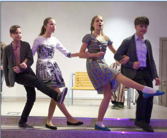
Полька из «Покровских ворот»