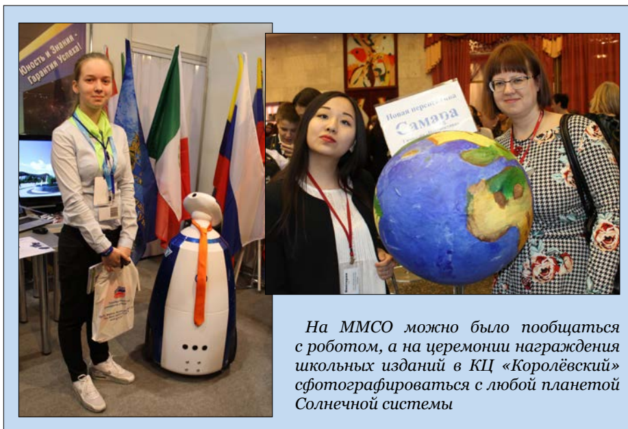
На ММСО можно было пообщаться с роботом, а на церемонии награждения школьных изданий в КЦ «Королёвский» сфотографироваться с любой планетой Солнечной системы