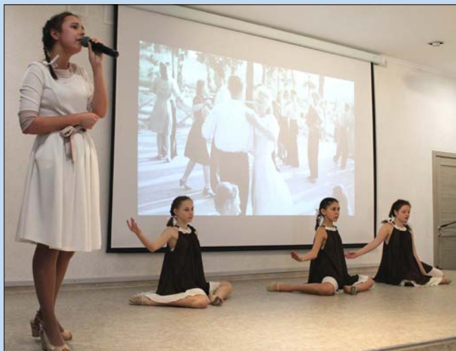
Трогательный номер «Ах, эти тучи в голубом»