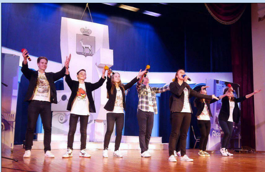
В такие моменты ребята по-настоящему получали наслаждение от игры и ощущали себя единой командой