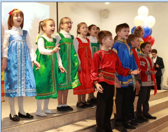
Выступает ансамбль «Музыкальная капель»