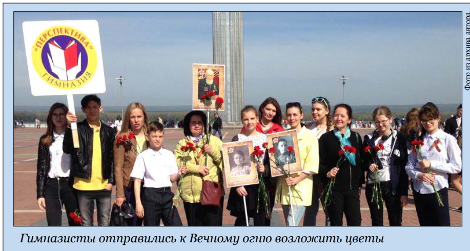
Гимназисты отправились к Вечному огню возложить цветы