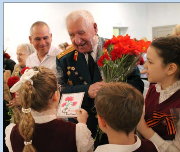
Каждый сам хотел подарить ветеранам цветы и открытки

В концерте прозвучало еще много песен, такие как «Два орла», «Ты ждешь, Лизавета!», которые исполнил