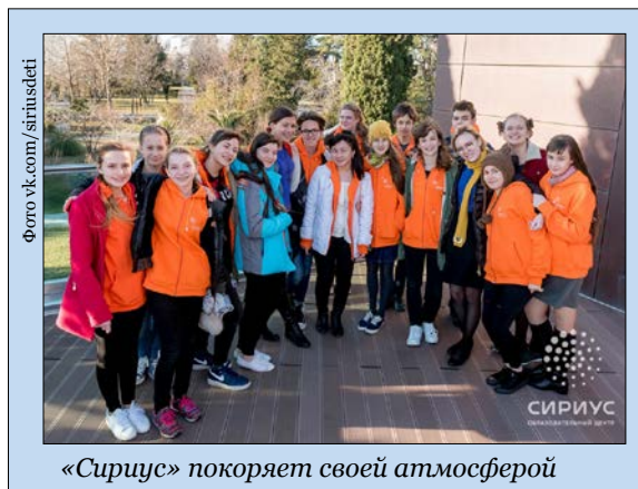
«Сириус» покоряет своей атмосферой