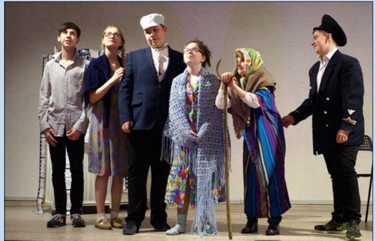
Финальная сцена фильма «Любовь и голуби»