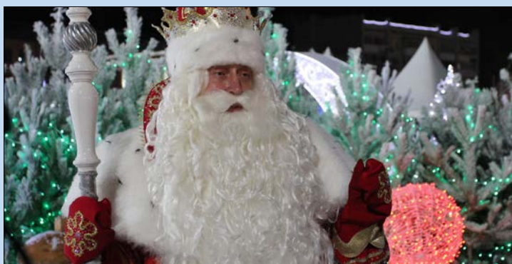
Привет от настоящего Деда Мороза