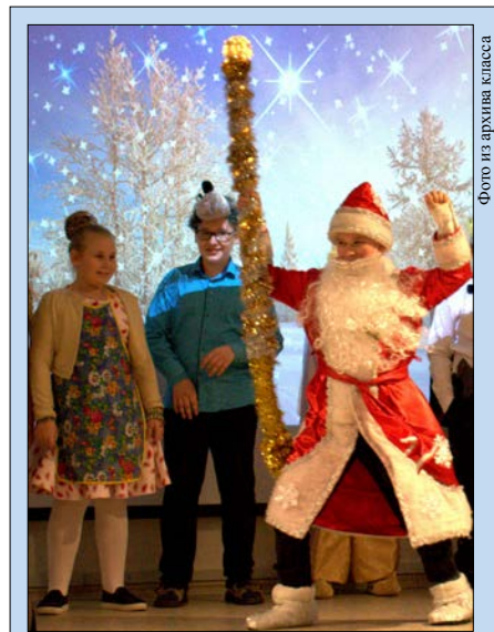
Всем понравилось готовиться к спектаклю и выступить на сцене

У меня была роль бабушки. Мне тяжело было представить себя в этой роли. Я репетировала перед зеркалом, вспоминала героев мультфильмов, но быть скучной бабушкой