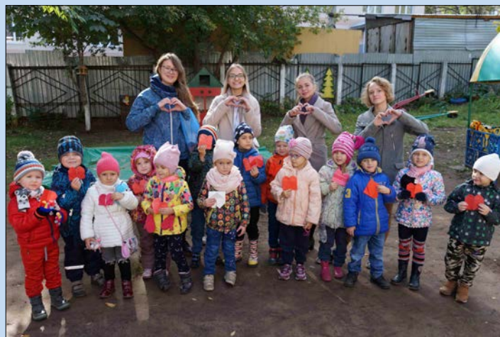
Акции гимназистов в центре «Семья» Промышленного района и в дошкольном отделении «Перспективы»