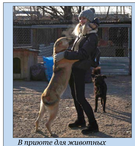
В приюте для животных