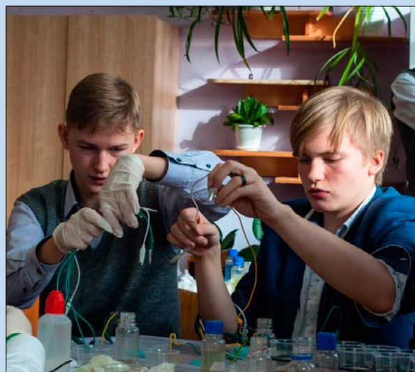
Ответственный момент — идет подключение химического источника тока

Сначала наш ждал образовательный день. Гимназисты и ребята из других школ узнали, как делать презентации и программировать в межплатформенной среде под названием «Unity». Также они учились использовать AR (дополнительную реальность).