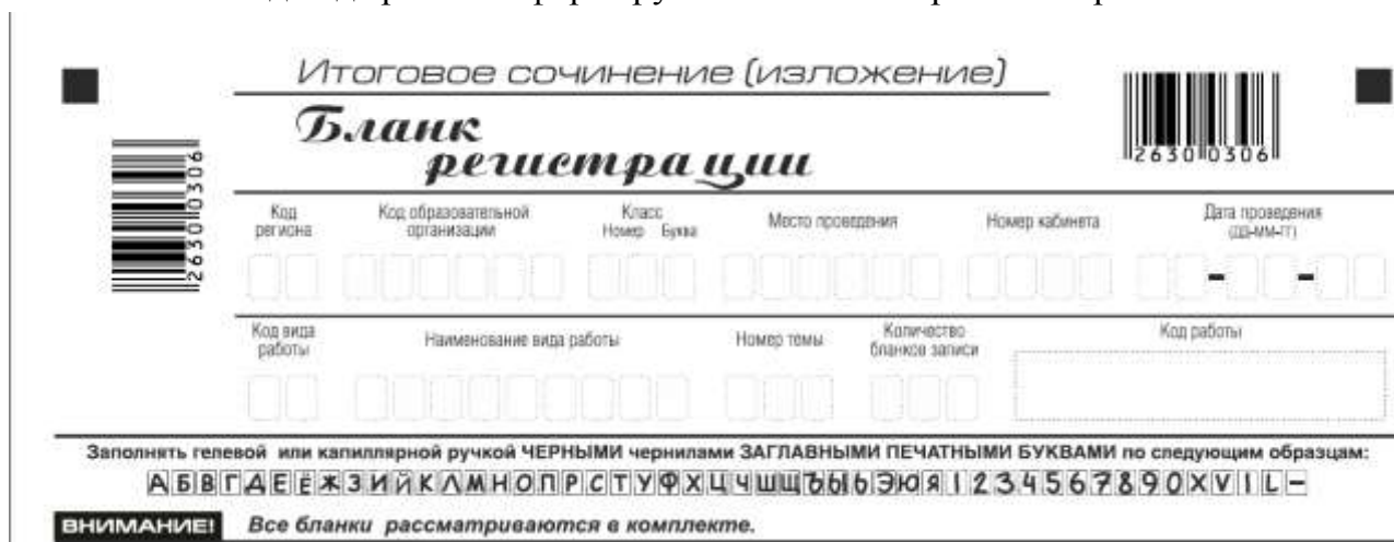
Рис. 2. Верхняя часть бланка регистрации

По указанию члена комиссии образовательной организации, осуществляющего инструктаж участников итогового сочинения (изложения), участником заполняются все поля верхней части бланка регистрации (см. табл. 1).