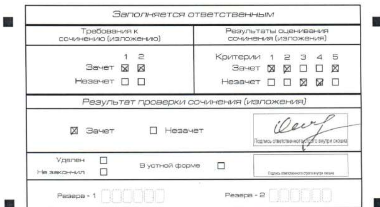
Рис. 8. Область для оценки работы

3. Во всех остальных случаях сочинение (изложение) проверяется по всем пяти критериям и оценивается по системе «зачет»/«незачет» (например, нельзя не проверять работу по критериям К4 и К5, если выпускник получил зачет на основании зачетов по критериям К1, К2, К3).